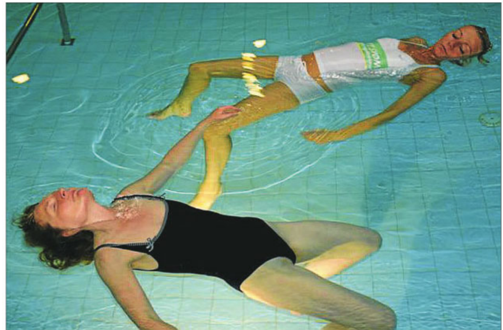
UNDERVISNINGEN AF vandskrækkere foregår fremover på Scheelsminde Hotel.

Arrangementet foregår på Scheelsminde Hotel den 12. maj fra 13-14. Man kan tilmelde sig på britt@brittsvoem.dk eller bare møde op til enten et besøg eller en gang undervisning.